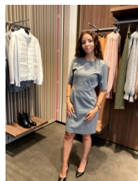
Relooking vêtement filles chez Burton of London.