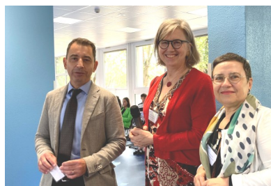
L'équipe organisatrice de l'événement

« UNE SEMAINE POUR SE PRÉPARER À LA RENCONTRE »