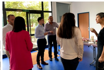
Professeurs, professionnels et étudiants participaient à l'événement, quelques échanges informels. en toute convivialité.

« ÉVEIL AU MONDE DE L'ENTREPRISE ET À SA COMPLEXITÉ, UN FUTUR PROFESSIONNEL DOIT RESTER ATTENTIF À SON ENVIRONNEMENT ET RESTER EN VEILLE CONTINUE. »