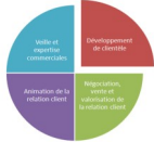
Pôle1: 4 domaines d'activités