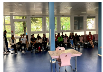
Des étudiants attentifs et en tenue professionnelle lors des présentations .