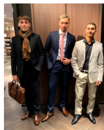
Relooking vêtement garçons chez Burton of London.